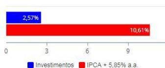
Investimentos x Meta de Rentabilidade

Nota-se que ao longo do exercício de 2020 a rentabilidade da carteira de Colombo Previdência ficou abaixo da meta atuarial traçada de IPCA + 6,00% a.a, cujo resultado foi de 10,61% a.a. Esse resultado foi gerado principalmente por causa do impacto trazido pelo Corona Vírus que afetou de um modo geral todo o mercado financeiro em especial no mês de março de 2020. Como pode-se observar, nos meses subsequentes houve recuperação gradativa dos ativos porém, apesar da recuperação o resultado ficou aquém à meta atuarial.