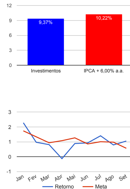
Acumulado no Ano